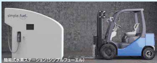
簡易式水素ステーション(シンプルフューエル)