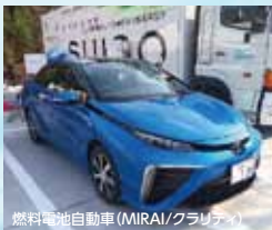
燃料電池自動車(MIRAI/クラリティ)